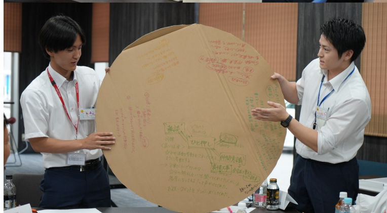
※円形の段ボールを用いてのディスカッション