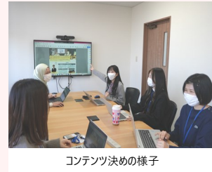
コンテンツ決めの様子