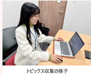
トピックス収集の様子

打ち合わせ前に各々が事前に収集したトピックス案を共有します。様々な部署から集まったメンバーで構成されているため、トピックスも豊富です。